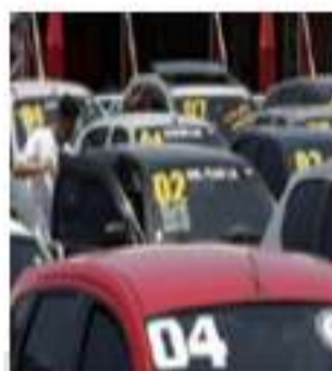
Tabela de Veículos Link FIPE